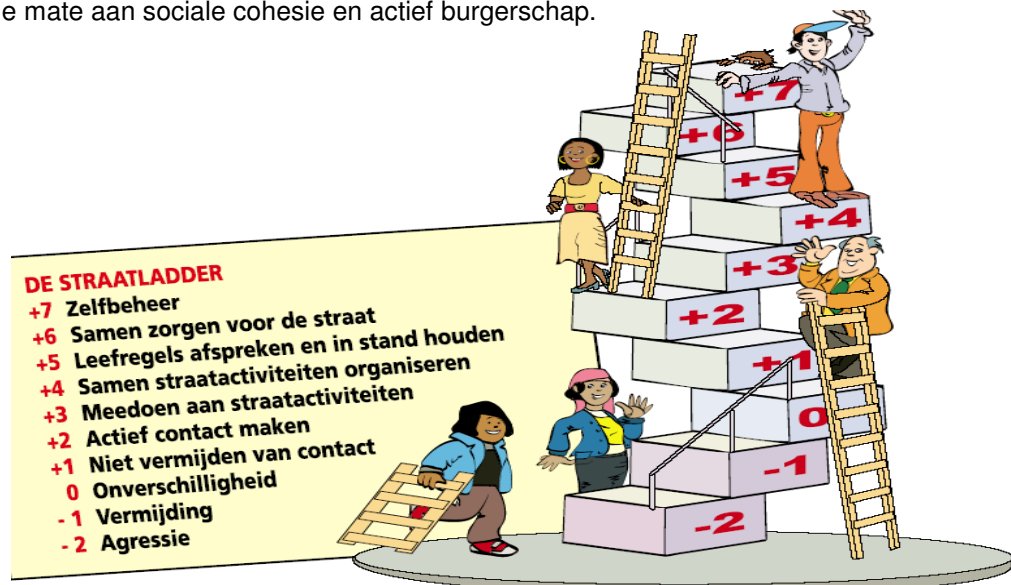
Tien treden van de straatladder

De Rotterdamse straataanpak gaat uit van een netwerkfilosofie. Het streven is om het netwerk (en daarmee het sociale kapitaal) van bewoners in hun straat te vergroten. Bewoners krijgen daardoor meer grip op de straat en zij kunnen meer gebruikmaken van elkaars talenten en mogelijkheden; ze worden 'goeie burens'. Hoe sterker in het beoogde straatnetwerk de binding, het vertrouwen en de wederkerigheid tussen bewoners, hoe beter de straat kan klimmen op de zogeheten straatladder tot het door de bewoners gewenste niveau. Deze straatladder is een graadmeter voor de mate van sociale samenhang en actief burgerschap. Hij geeft de ontwikkelfases van een straat aan. Elke trede staat voor een bepaalde mate aan sociale cohesie en actief burgerschap.