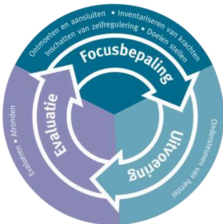
Figuur 1. Krachtgericht begeleidingstraject

De begeleiding bestaat uit opeenvolgende individuele gesprekken met de cliënt, gezamenlijke activiteiten met de cliënt en systeemgesprekken tussen de cliënt en relevante derden, waaronder familieleden. In de individuele gesprekken bespreken de begeleider en de cliënt hoe het staat met de acties om de doelen te bereiken, of de doelen al dichterbij komen, welke nieuwe vervolgacties eventueel nodig zijn en wie deze acties gaat uitvoeren. Deze acties worden genoteerd in het actieplan, dat telkens bijgewerkt wordt.