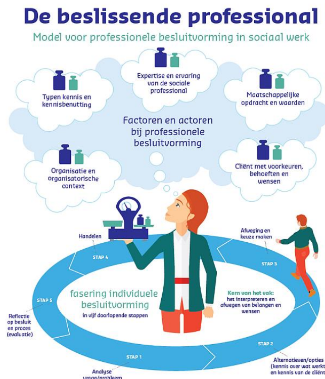
Afbeelding 2: De beslissende professional

In dit actieonderzoek hebben we behalve naar de rol van het team bij de pedagogische civil society, ook gekeken hoe de wijze waarop het team besluiten neemt versterkt kan worden. Professionele besluitvorming definieerden we in eerder onderzoek als: ‘de wijze waarop sociaal professionals hun handelen inrichten, de keuzes die ze daarbij maken en hoe die keuzes tot stand komen’ (Spierts et al., 2017a, p. 14). Op basis van dit eerdere onderzoek is een model van professionele besluitvorming ontwikkeld (zie afbeelding 2).