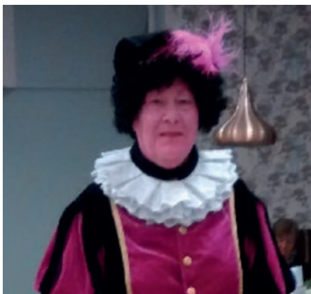
↑ Een voorbeeld van 'activiteiten met een roze randje' van Brabant Zorg: Roze Piet