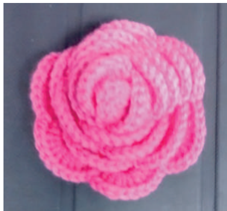
↑ Een voorbeeld van 'activiteiten met een roze randje' van Brabant Zorg (met dank aan Sonja Haven): Bloemcoursage