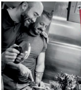
↑ Regenboogkookworkshop door SWOA Arnhem