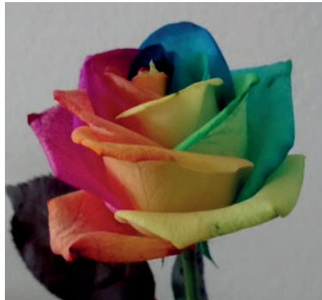
↑ Een voorbeeld van 'activiteiten met een roze randje' van Brabant Zorg: Regenboogros