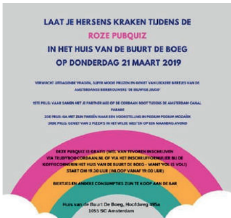
↑ ABC Alliantie Welzijn en Cordaan organiseren een roze pubquiz