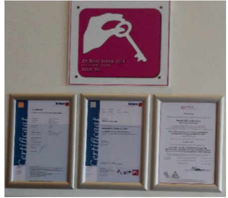
↑ Bij verpleeghuis De Venser van Amstelring in Amsterdam Zuidoost hangt de Roze Loper-plaquette als teken van LHBT-vriendelijkheid.