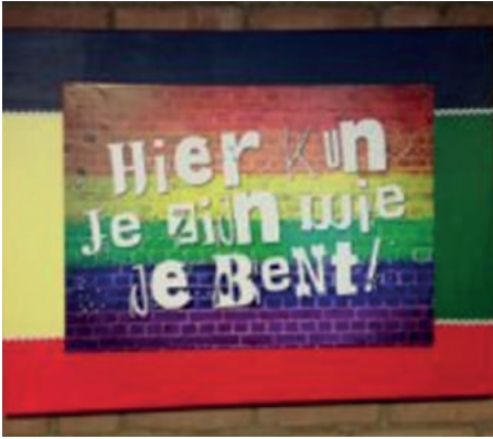
↑ Brabant Zorg maakt op deze manier duidelijk dat iedereen zichzelf kan zijn.