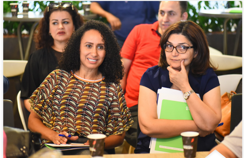
Deelnemers tijdens een bijeenkomst voor gespreksleiders van de Alliantie Verandering van Binnenuit.