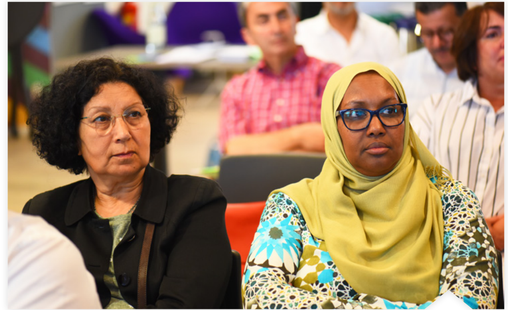
Deelnemers tijdens een bijeenkomst voor gespreksleiders van de Alliantie Verandering van Binnenuit.