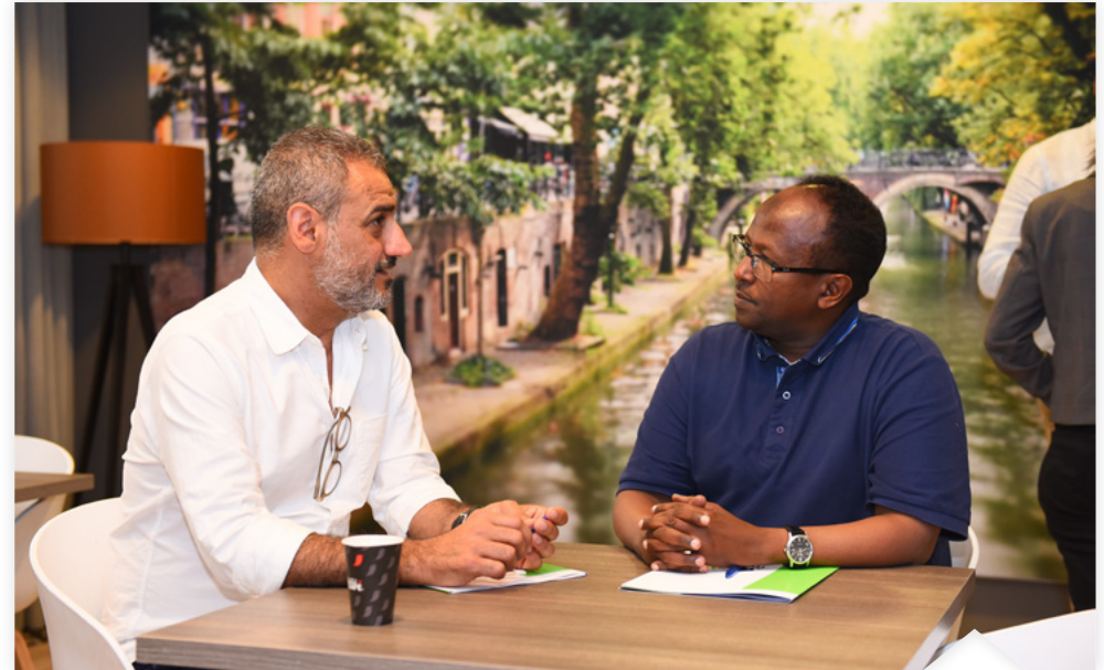
Deelnemers tijdens een bijeenkomst voor gespreksleiders van de Alliantie Verandering van Binnenuit.

In de bijeenkomsten van het consortium is het de bedoeling om sociale normen te veranderen in de richting van (meer) zelfbeschikking, non-discriminatie en het tegengaan van geweld. Dat kan omdat die sociale normen niet in beton gegoten zijn en steeds aan verandering onderhevig zijn. Ze veranderen bijvoorbeeld vaak op een 'natuurlijke' wijze van generatie op generatie.