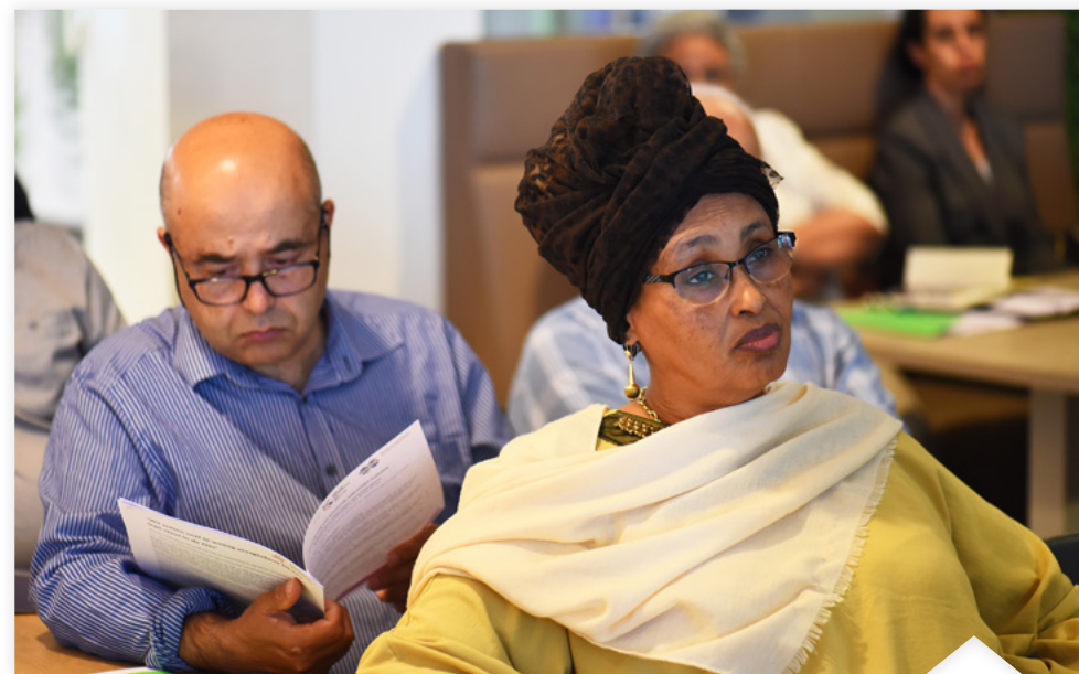
Deelnemers tijdens een bijeenkomst voor gespreksleiders van de Alliantie Verandering van Binnenuit.

In Nederland vinden regelmatig schendingen plaats van fundamentele rechten die verband houden met het zelfbeschikkingsrecht: huwelijksdwang, kindhuwelijken, achterlating, eengerelateerd geweld, gedwongen isolement en intolerantie ten aanzien van homo- en biseksuelen en transgenders (Smits van Waesberghe et al., 2017). In het bijzonder voor vrouwen en meisjes staat het recht op zelfbeschikking onder druk. Over het (seksuele) gedrag en kleding van vrouwen en meisjes wordt vaker en harder geoordeeld en geroddeld dan over die van mannen en jongens. Ook krijgen meisjes en vrouwen vaker vanuit hun omgeving minder ruimte voor zelfbeschikking. En ook de