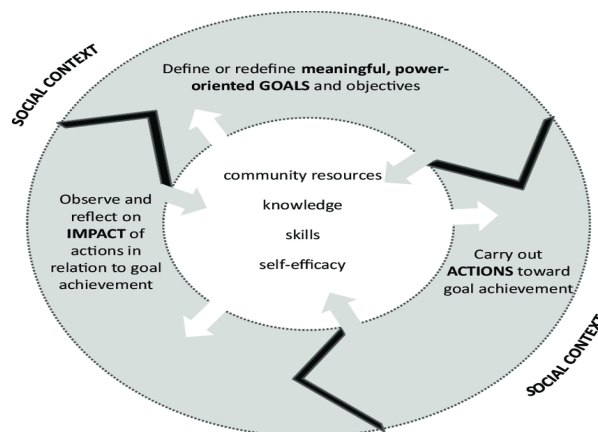
Figuur 1 : Het proces van empowerment (Cattaneo en Chapman, 2010).

Cattaneo en Chapman (2010) omschrijven empowerment als een proces waarbij een persoon die geen kracht heeft, een betekenisvol doel stelt gericht op het vergroten van kracht, actie neemt richting het doel, observeert en reflecteert op de impact van de actie, gebruikmakend van zijn of haar evoluerende zelfeffectiviteit, kennis en competentie gerelateerd aan het doel. De sociale context beïnvloedt deze componenten en de samenhang.