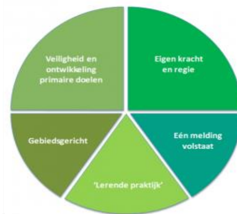
Figuur 3: SAVE-werkwijze (Van Montfoort, 2015)

De uitgangspunten zijn in beeld gebracht aan de hand van onderstaand figuur: