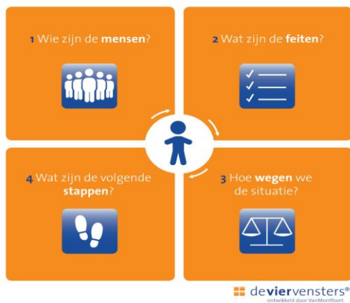
Figuur 4: De vier vensters van het SAVE-plan, afkomstig van de website www.werksamenaanveiligheid.nl .

Onderdeel van de SAVE-werkwijze is het maken van een SAVE-plan dat bestaat uit vier vensters. Op de website www.werksamenaanveiligheid.nl 7 is te lezen dat het plan directbetrokkenen, netwerk en professionals helpt om binnen de door de SAVE-professional vastgestelde termijn een 'goed genoeg' situatie te realiseren. In het plan zijn de voorwaarden omgezet in doelen en is er concreet beschreven wie wat doet (afspraken); daarbij zijn de door de SAVE-professional gegeven adviezen eventueel benut. Bij overeenstemming van het plan kan worden overgegaan tot de start van de uitvoering.