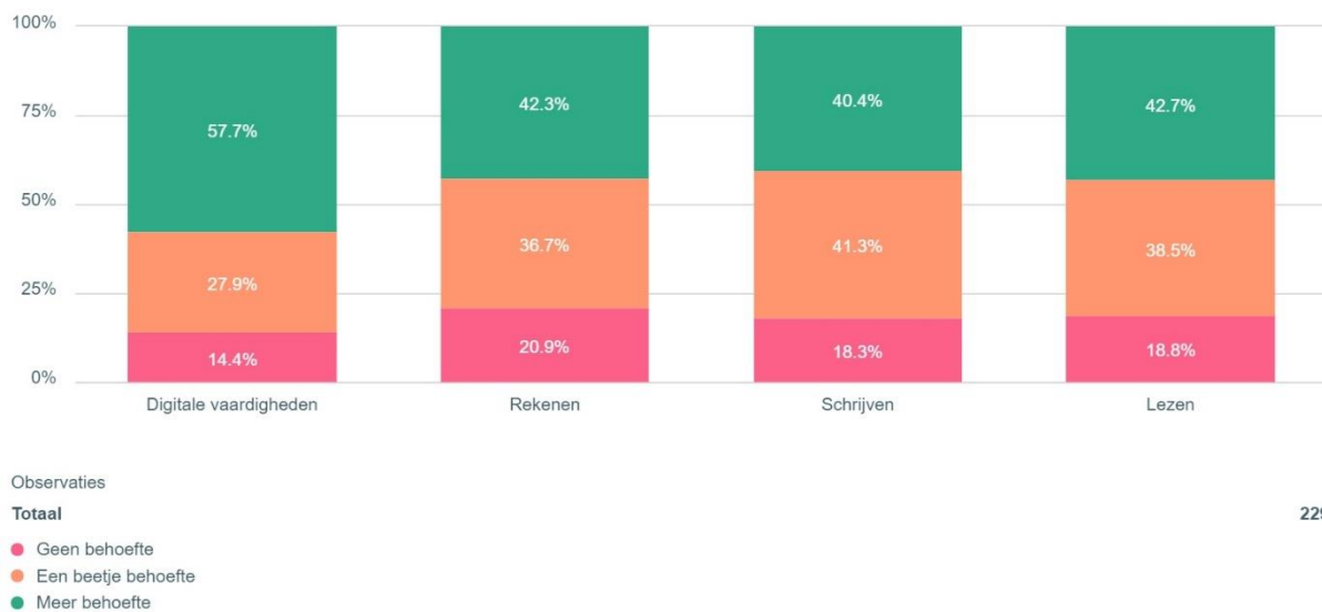
Figuur 2 In hoeverre heb je behoefte aan kennis over onderstaande basisvaardigheden?

De respondenten zijn gevraagd naar de mate waarin zij behoefte hebben aan kennis over basisvaardigheden, meer specifiek naar lezen, schrijven, rekenen en digitale vaardigheden.