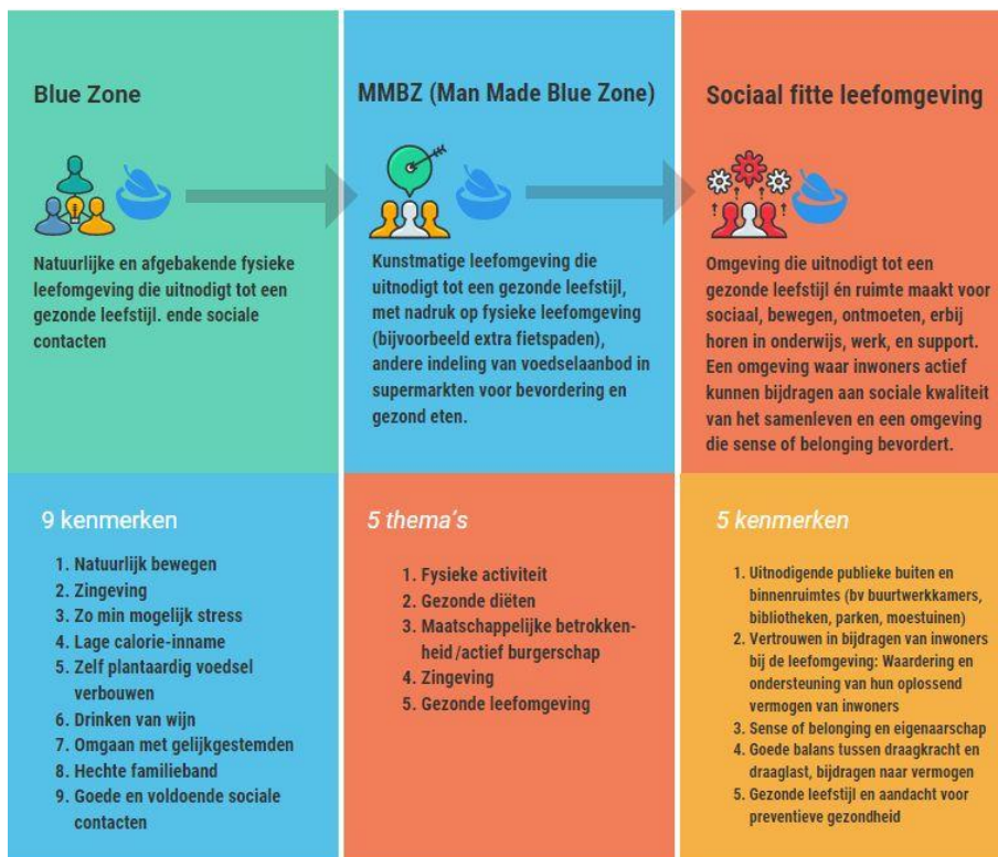
Figuur 2 – Kenmerken van een Blue Zone , een Man Made Blue Zone en een eerste verkenning van een sociaal fitte leefomgeving met de focus op gezondheid 6

© 2022 Kromhout, Van de Lustgraaf & Jak (Movisie)