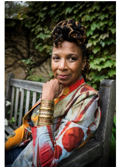
Professor Kimberlé Crenshaw