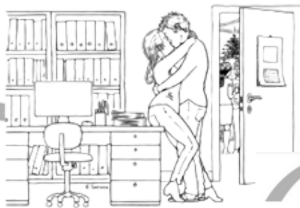
Een leidinggevende kust met een collega. Ze zijn weggeslopen op een feestje. Ze vinden het allebei fijn.